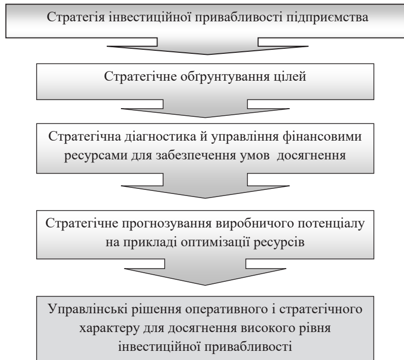
Рис. 2. Етапи розроблення стратегії інвестиційної привабливості промислового підприємства