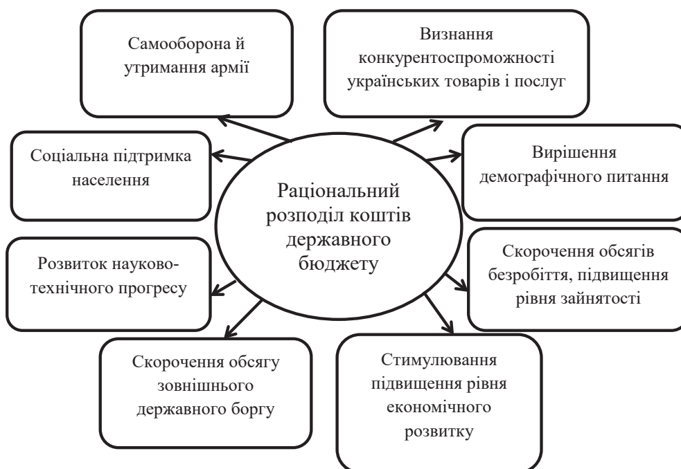
Рис. 2. Явища, залежні від формування державного бюджету

На сучасному етапі розвитку України розроблення та впровадження дієвого механізму забезпечення бюджетної безпеки є пріоритетним завданням, вирішення якого стане гарантією прогресу вітчизняної економіки, суверенітету країни, її фінансової незалежності, а також забезпечення гідного рівня соціальної підтримки громадян України [6, с. 19].