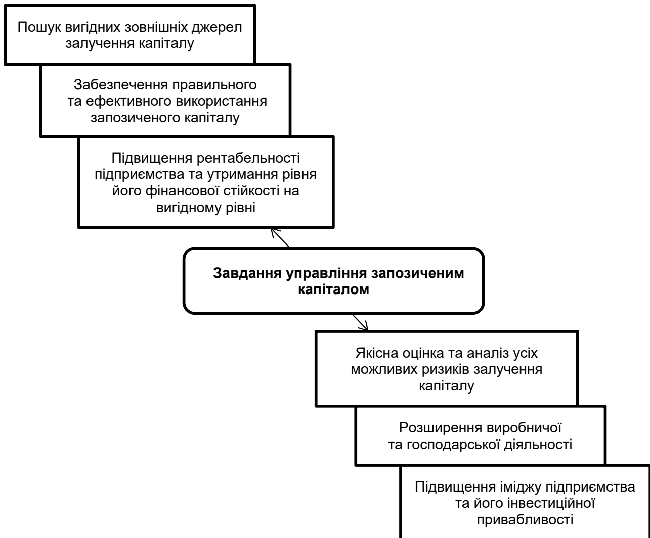
Рис. 3. Завдання управління запозиченим капіталом

– правильне визначення найбільш оптимально необхідної частки власного капіталу в загальній структурі капіталу підприємства;