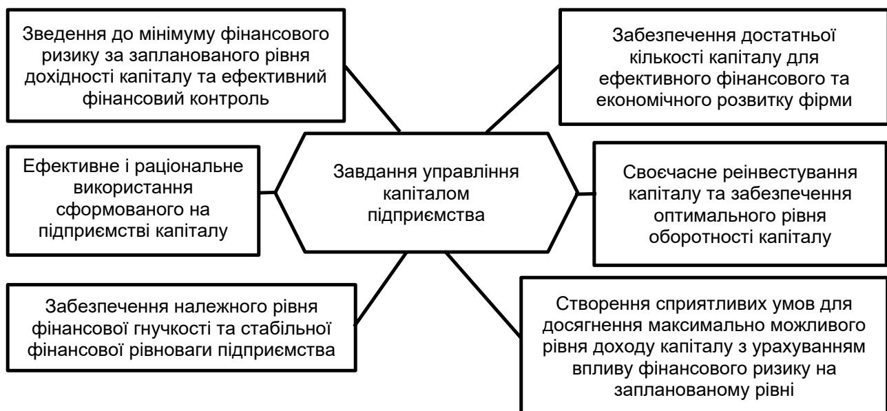
Рис. 1. Завдання управління капіталом підприємства

Управління структурою капіталу є важливим напрямом управління діяльністю підприємства загалом. Завдяки управлінню структурою капіталу керівництво промислового підприємства формує оптимальне співвідношення власних та запозичених коштів задля нарощення власного капіталу та збільшення прибутку, збереження фінансової стійкості підприємства та стабілізації його господарської діяльності. Підприємства, в тому числі промислові, в структурі свого