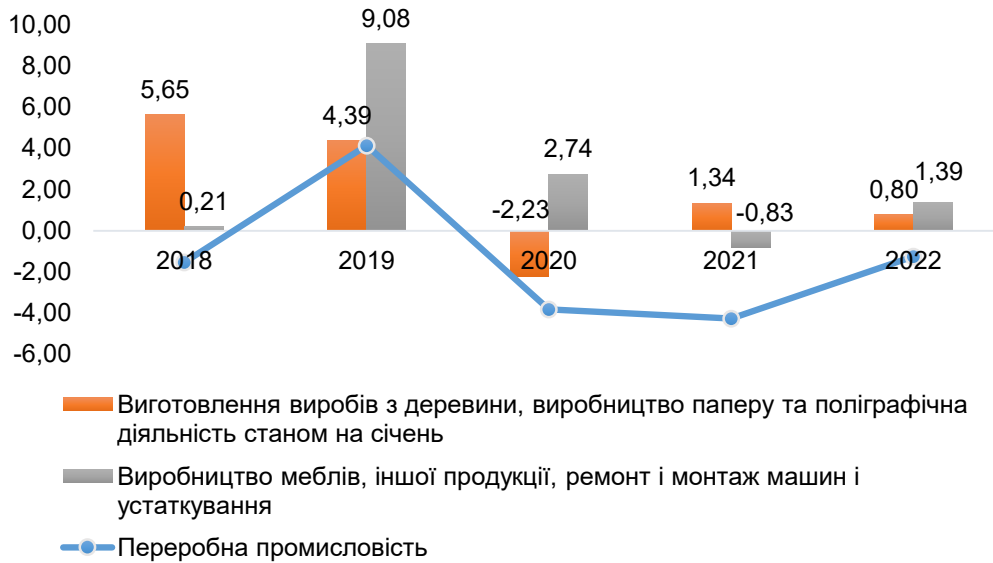
Рис. 1. Темпи приросту (скорочення) чисельності зайнятих у переробній промисловості, у % до січня попереднього року