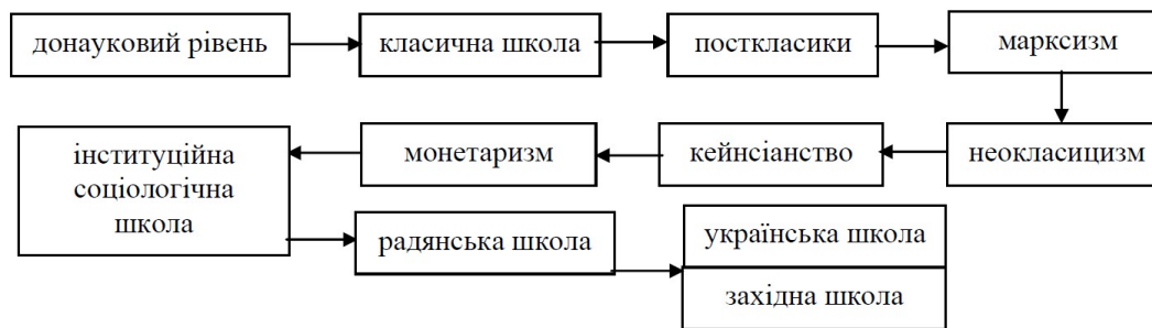
Рис. 2. Генезис понять ринку праці