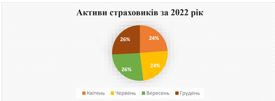
Рис. 2. Активи страховиків України за 2022 рік.